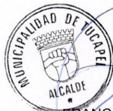
FRANCISCO JAVIER DUEÑAS AGUAYO ALCALDE (S)