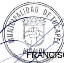
FRANCISCO JAVIER DUEÑAS AGUAYO ALCALDE (S)