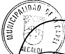
FRANCISCO JAVIER DUEÑAS AGUAYO ALCALDE (S)