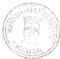
JOSÉ FERNÁNDEZ ALISTER ALCALDE I. MUNICIPALIDAD DE TUCAPEL