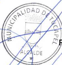
FRANCISCO DUEÑAS AGUAYO ALCALDE (S)