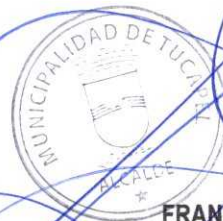
FRANCISCO JAVIER DUEÑAS AGUAYO ALCALDE (S)